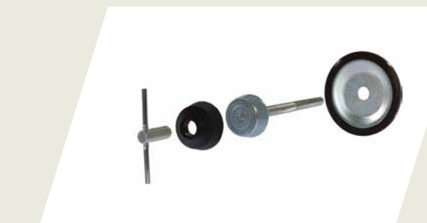
BULÓN DE SEGURIDAD PARA RUEDA DE AUXILIO