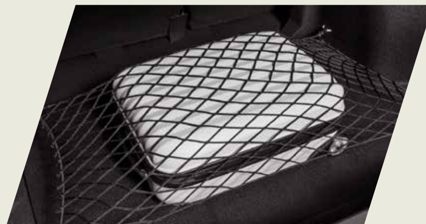
RED ELÁSTICA PARA BAUL