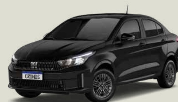
806 - Negro Vulcano