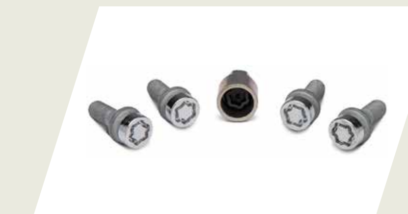
JUEGO DE TORNILLOS ANTIROBOS PARA RUEDA