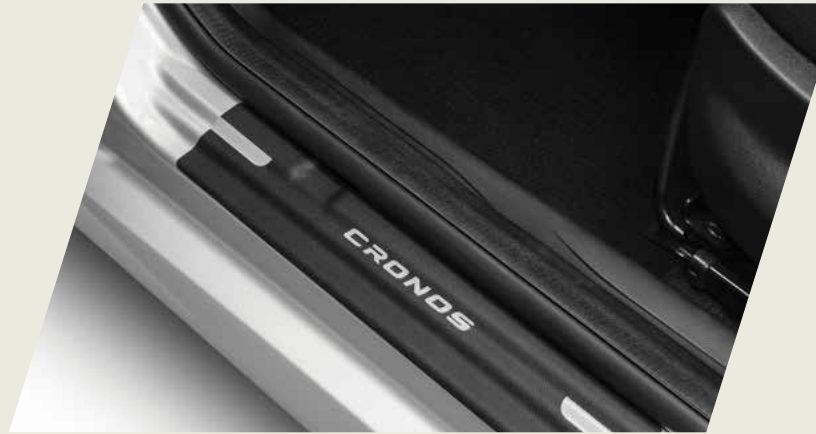
PROTECTOR DE ZÓCALO EN VINILO

Acercate a un concesionario y conocé la gama de accesorios originales que mopar te ofrece para equipar tu fiat Cronos, seguido de las imágenes de cada accesorio.