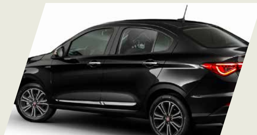
MOLDURA DE PUERTA CROMADA