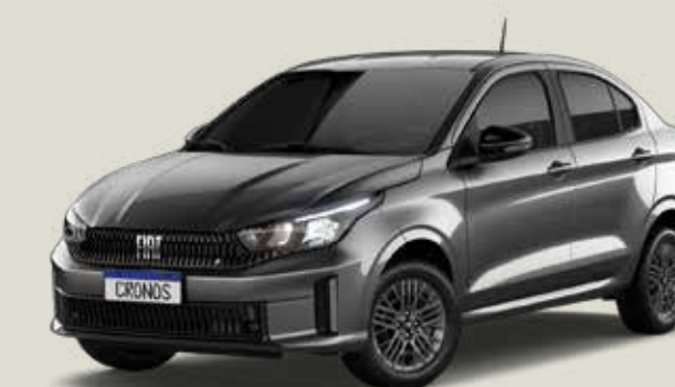
979 - Gris Silverstone