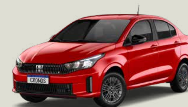
978 - Rojo Montecarlo