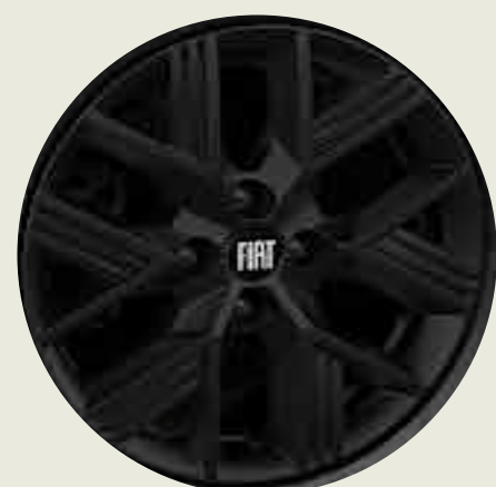
Llantas de aleación 15" oscurecidas