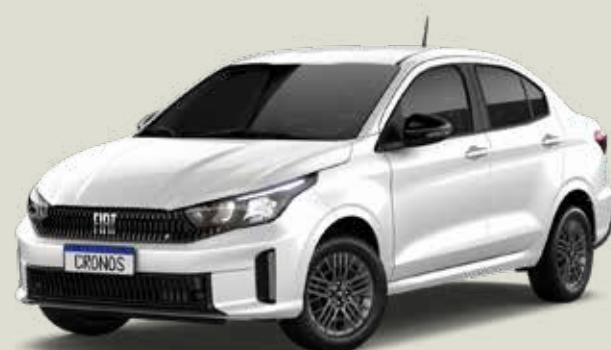
249 - Blanco Banchisa