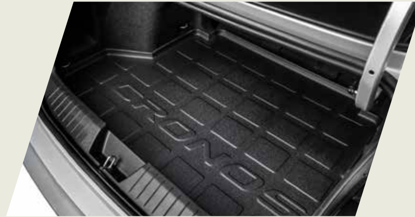
ALFOMBRA BAUL ANTIDERRAME