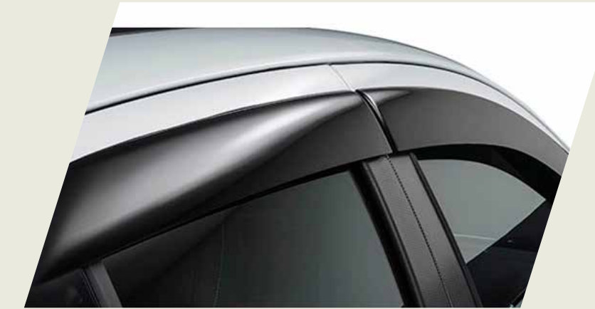
DEFLECTOR DE LLUVIA