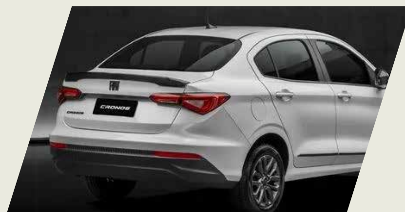
SPOILER TAPA BAÚL