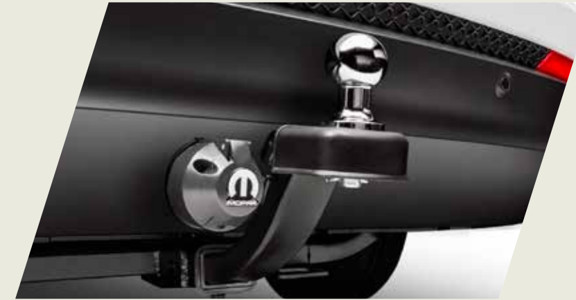
GANCHO DE REMOLQUE