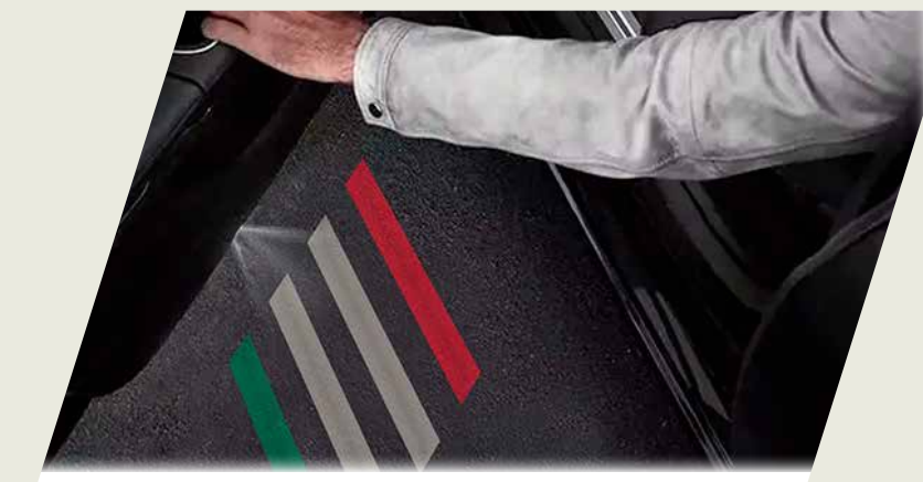
PROYECTOR DE LOGO FIAT