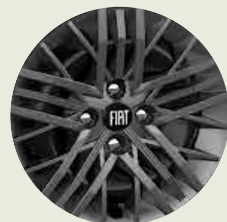
Llantas de aleación 15"