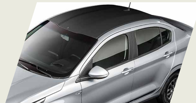
VINILO NEGRO PARA TECHO