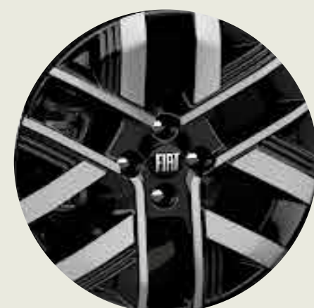
Llantas de aleación 16" esmaltadas