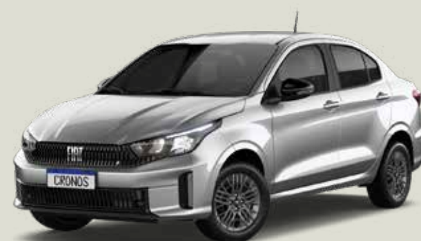
619 - Plata Bari