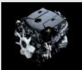
Motor 1GD (2.8l) - 163 CV

*Diésel con contenido de azufre menor a 10 ppm. **Toyota Safety Sense, integra diferentes sistemas de seguridad activa que pueden variar según cada modelo y/o versión. A su vez, estos sistemas están diseñados para asistir al conductor, no para sustituirlo. El conductor debe mantener en todo momento el control de su vehículo y es responsable de su conducción, por cuanto estos sistemas no reemplazan la conducción segura. El correcto funcionamiento del Toyota Safety Sense y de los distintos tipos de sistemas que equipa, depende de muchos factores incluyendo las condiciones del camino, el clima y el vehículo, razón por la cual el/los sistemas podrán verse afectados u obstaculizados debido a factores externos, no siendo Toyota Argentina S.A. responsable de las consecuencias derivadas del uso del sistema. Para más información sobre Toyota Safety Sense, dirigirse a la web toyota.com.ar o consulte el manual de usuario. ***Disponible solo por conexión USB. Verifique la compatibilidad de tu modelo con el fabricante.