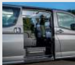
Puertas traseras laterales con apertura eléctrica