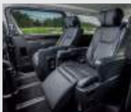
Segunda fila de asientos con regulación eléctrica y calefaccionados