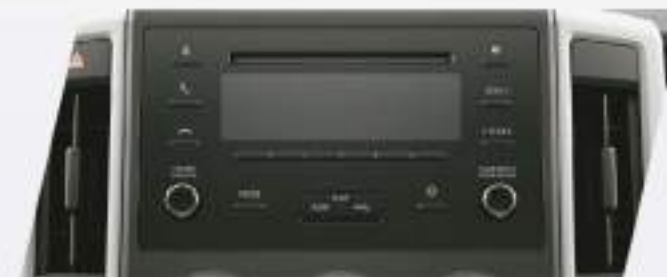
Audio con CD, MP3, USB, Bluetooth® y manos libres