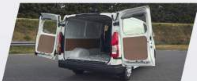
Portón trasero de doble hoja, vidriado, con apertura 90°/180°

Bienvenido al mundo del confort en el espacio de trabajo eficiente. Bienvenido a Toyota Hiace.