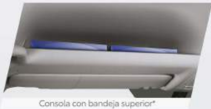
Consola con bandeja superior*