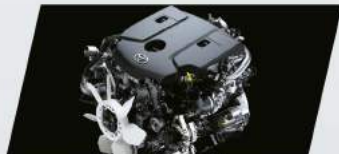
Motor 1GD de 177CV