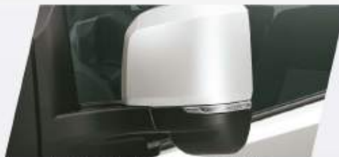
Espejos exteriores de giro angular*