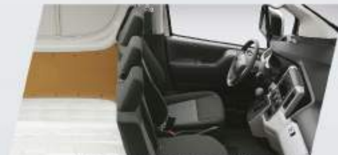
Apoya cabezas delanteros (x3)