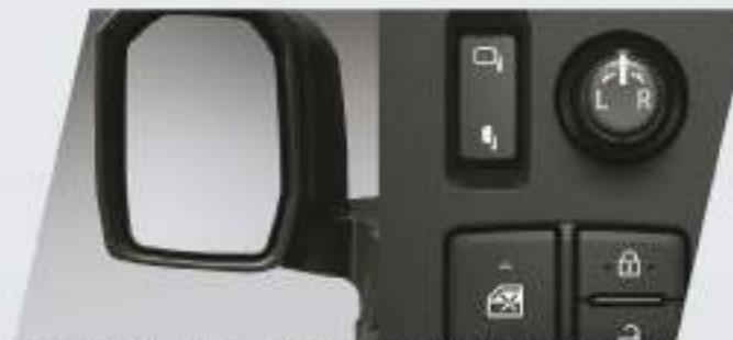
Espejos exteriores con ajuste y plegado eléctrico