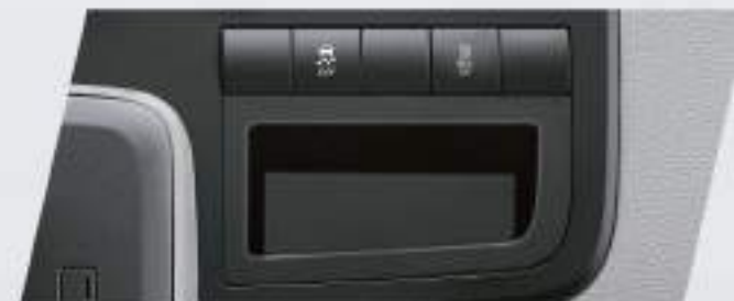
Control de estabilidad (VSC) y Control de tracción (TRC)