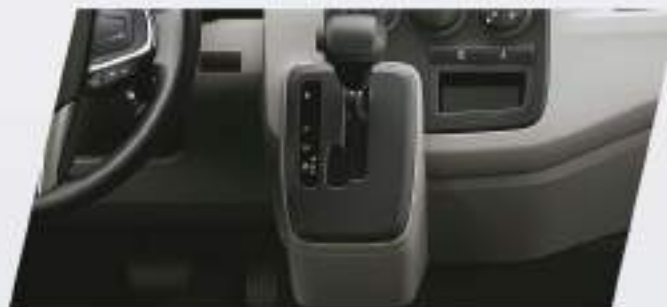
Caja automática de 6 velocidades