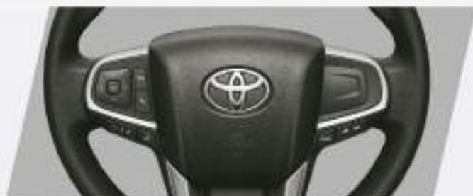
Volante multifunción con control de audio y de teléfono