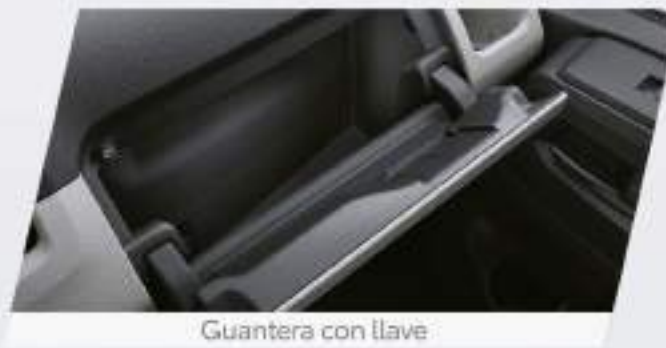
Ganterera con llave