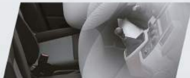
Airbag frontales (x2) con protección para 3 ocupantes