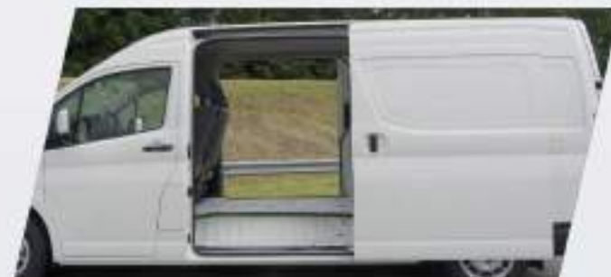
Doble puerta de acceso lateral*