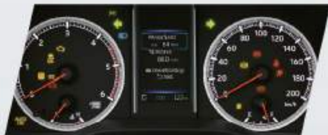
Display de información múltiple con pantalla de color de 4,2" (TFT)