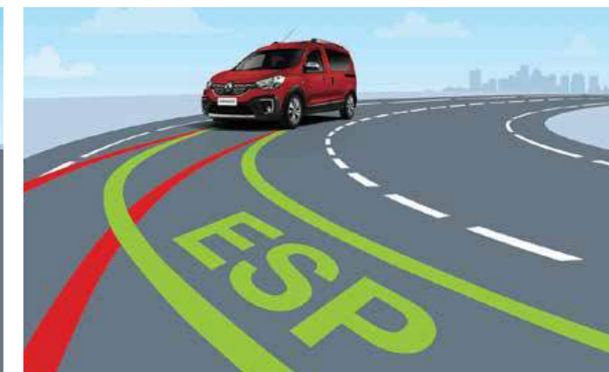
Control Electrónico de Estabilidad (ESP)