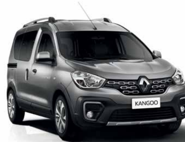
Gris Cuarzo (KNS)