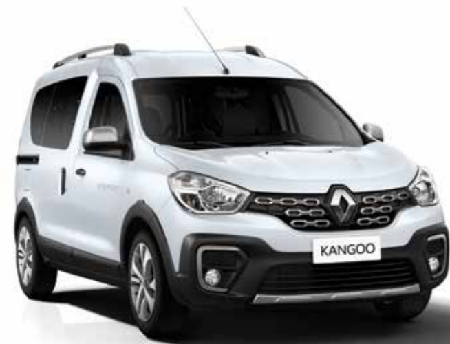
Blanco Glaciar (369)