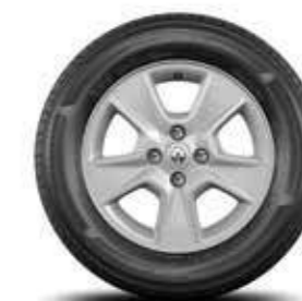
Llantas de aleación 15"