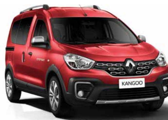
Rojo Fuego (B79)