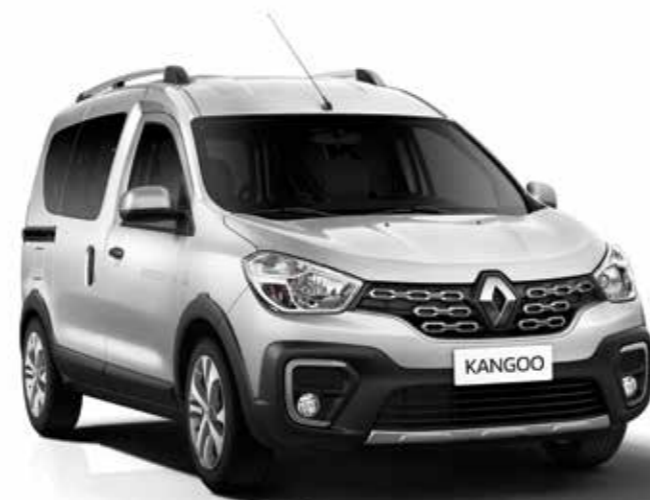
Gris Estrella (KNH)