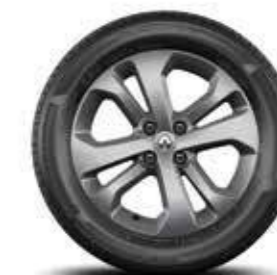
Llantas de aleación 16"