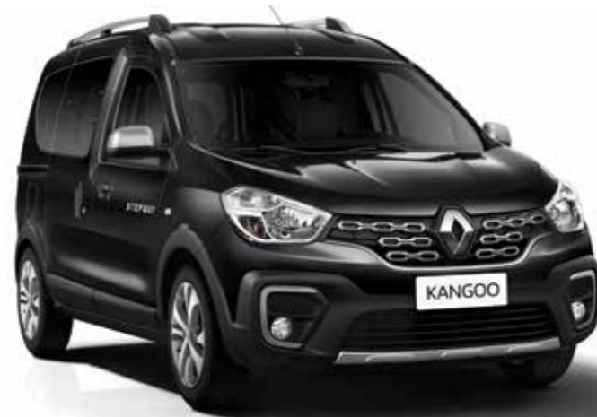
Negro Nagré (676)