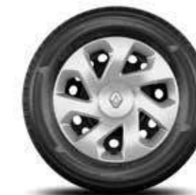
Llantas Acero 15"