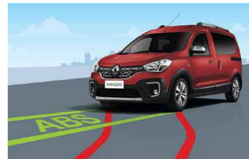
Frenos con ABS