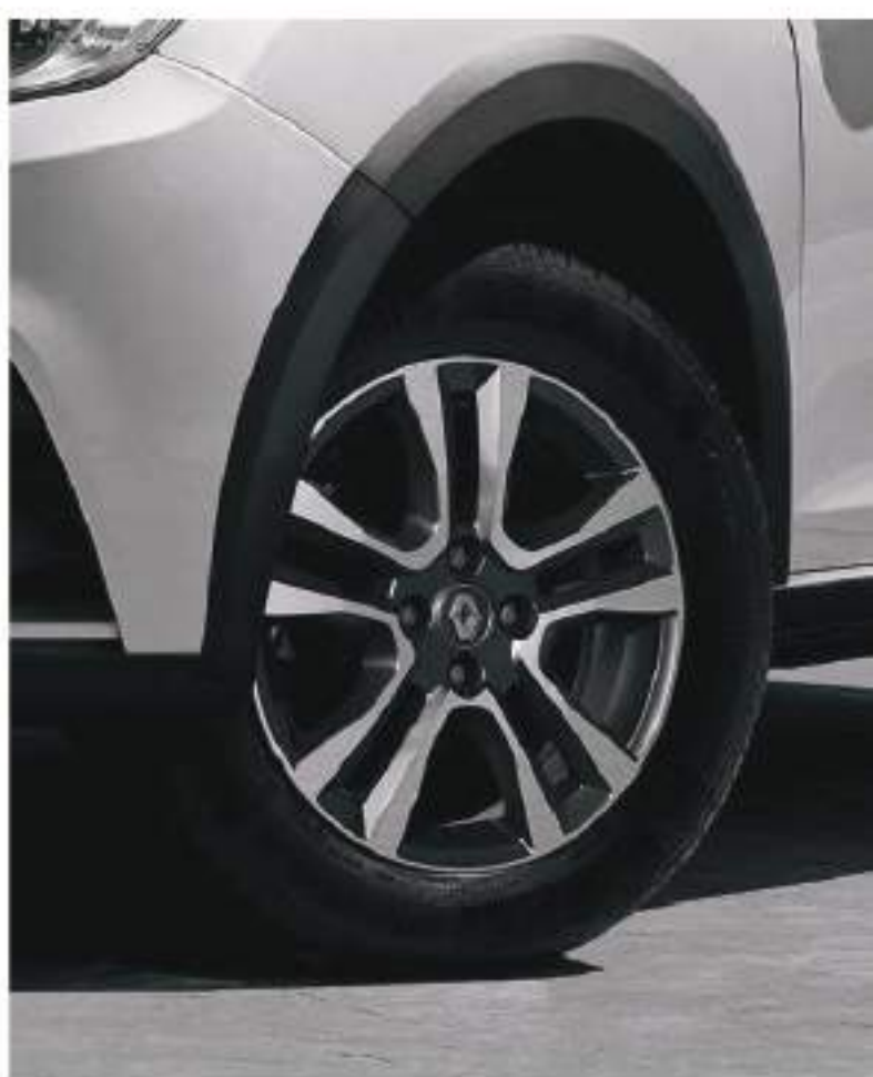
llantas diamantadas 16"