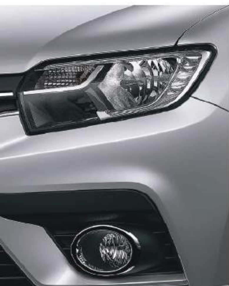
faros DRL LED en formato C-Shape característicos

las llantas diamantadas de 16" completan su estilo