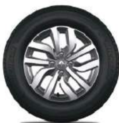
llanta de aleación de 15"