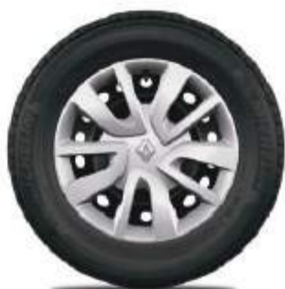
llanta de acero de 15"