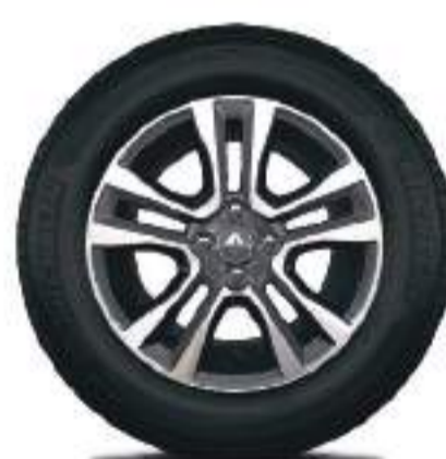
llanta diamantada de 16"