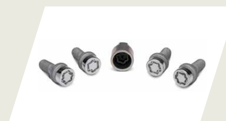
JUEGO DE TORNILLOS ANTIROBOS PARA RUEDA