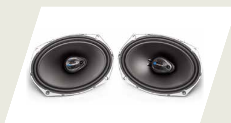
KIT PARLANTES DELANTEROS