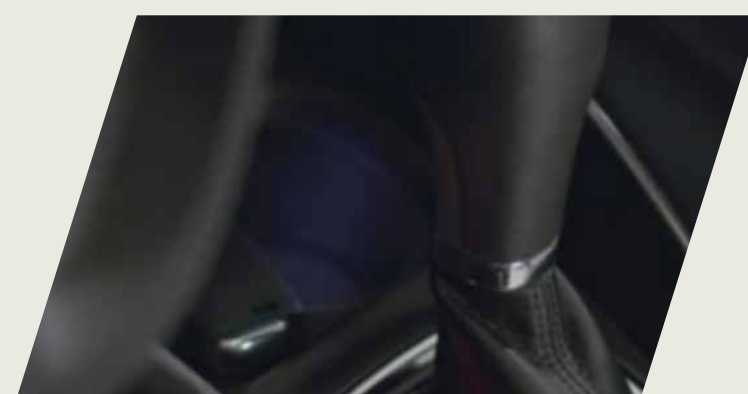
KIT ILUMINACION INTERIOR