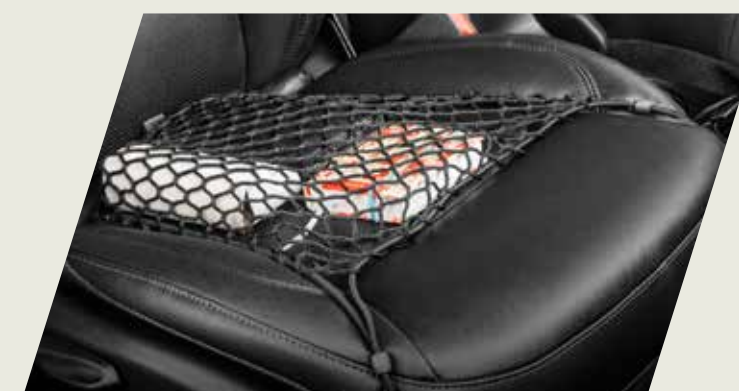
RED ELÁSTICA DE ASIENTO DELANTERO