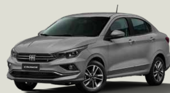
692 - Gris Silverstone