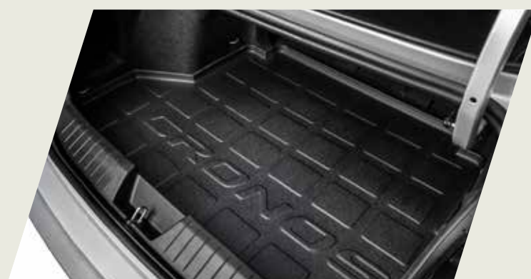
ALFOMBRA BAUL ANTIDERRAME