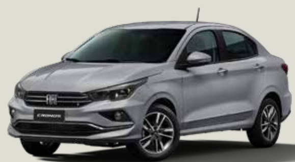
619 - Plata Bari