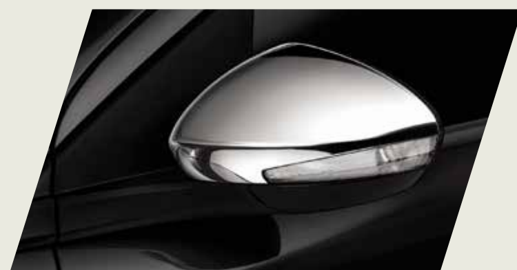
TAPA ESPEJO RETROVISOR EXTERNO CROMADO

Acercate a un concesionario y conocé la gama de accesorios originales que mopar te ofrece para equipar tu fiat Cronos, seguido de las imágenes de cada accesorio.