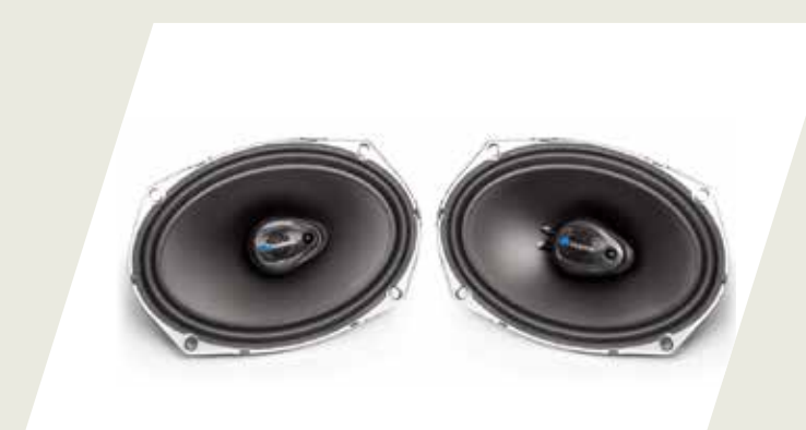
KIT PARLANTES TRASEROS