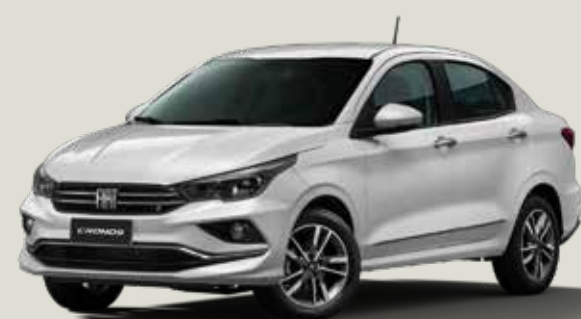
534 - Blanco Alaska