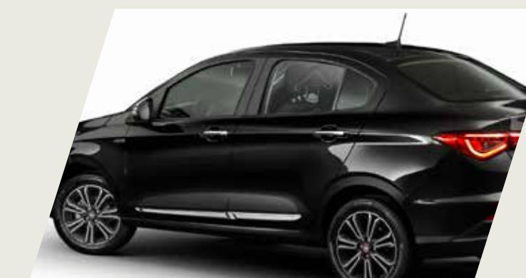
MOLDURA DE PUERTA CROMADA