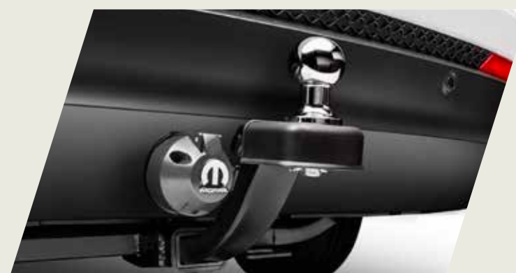
GANCHO DE REMOLQUE