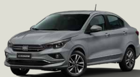
540 - Gris Strato