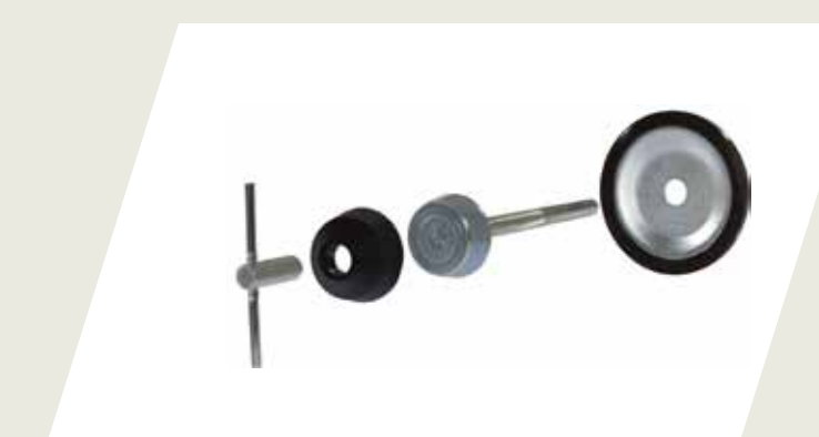
BULÓN DE SEGURIDAD PARA RUEDA DE AUXILIO