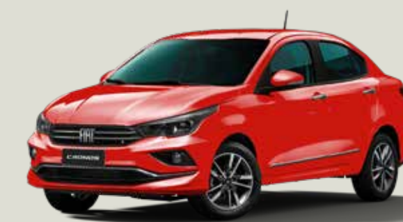
978 - Rojo Montecarlo