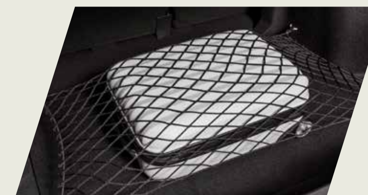
RED ELÁSTICA PARA BAUL