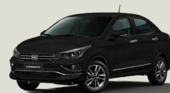
806 - Negro Vulcano