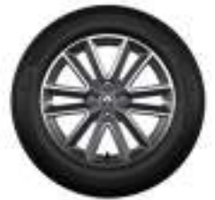
Llanta Diamantada de 16"