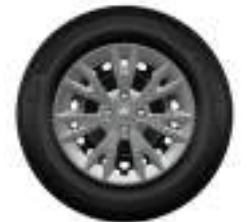
Llanta de aleación 15"