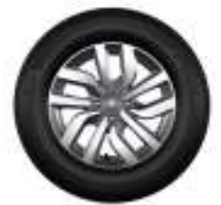
Llanta de aleación de 15"