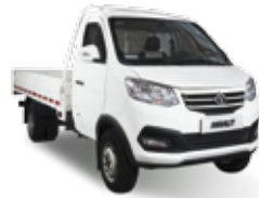
CABINA SIMPLE DUAL