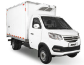
BOX REFRIGERADO DUAL (-18 C)