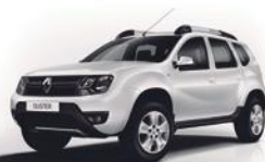
369 - BLANCO GLACIAR