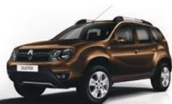
CNA - MARRÓN