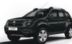
676 - NEGRO NACRÉ