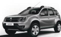
KNH - GRIS ESTRELLA