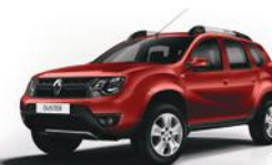
B76 - ROJO FUEGO