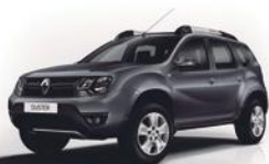
KNA - GRIS COMET